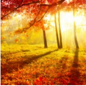
Be gin van de herfst